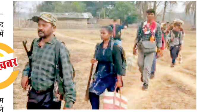
दंडकारण्य क्षेत्र हुआ नेतृत्वहीन